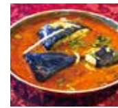
キーマなすカレー Keema nasu