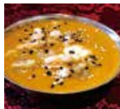
シーフードカレー Seafood