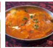
バターチキンカレー Butter Chicken